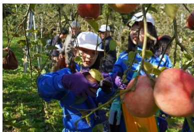
【11/14 3・4・8年生りんご収穫】